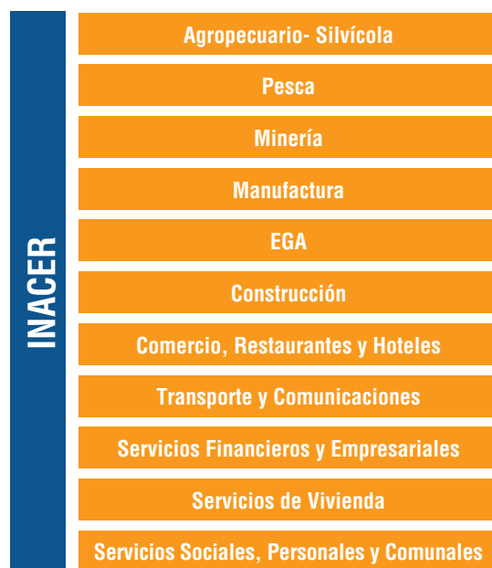
Figura 1: Estructura del Indicador de Actividad Económica Regional